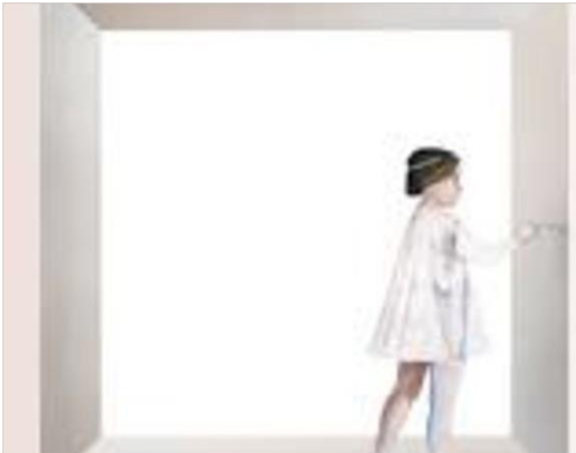
Abitare Gonzaga 2016. Arte, design e spazi domestici a confronto con il passato