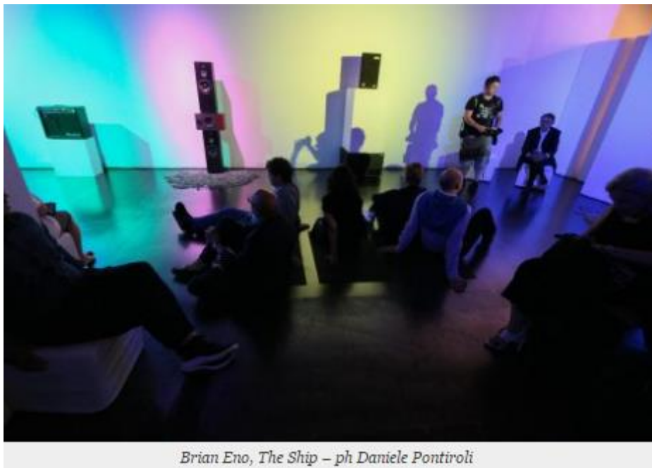
Brian Eno, The Ship

Nel video che vi proponiamo potete vedere entrambi i lavori, accompagnati da una serie di interviste all'artista e ai promotori dell'iniziativa, che nasce in occasione della nomina della città a Capitale Italiana della Cultura 2016.