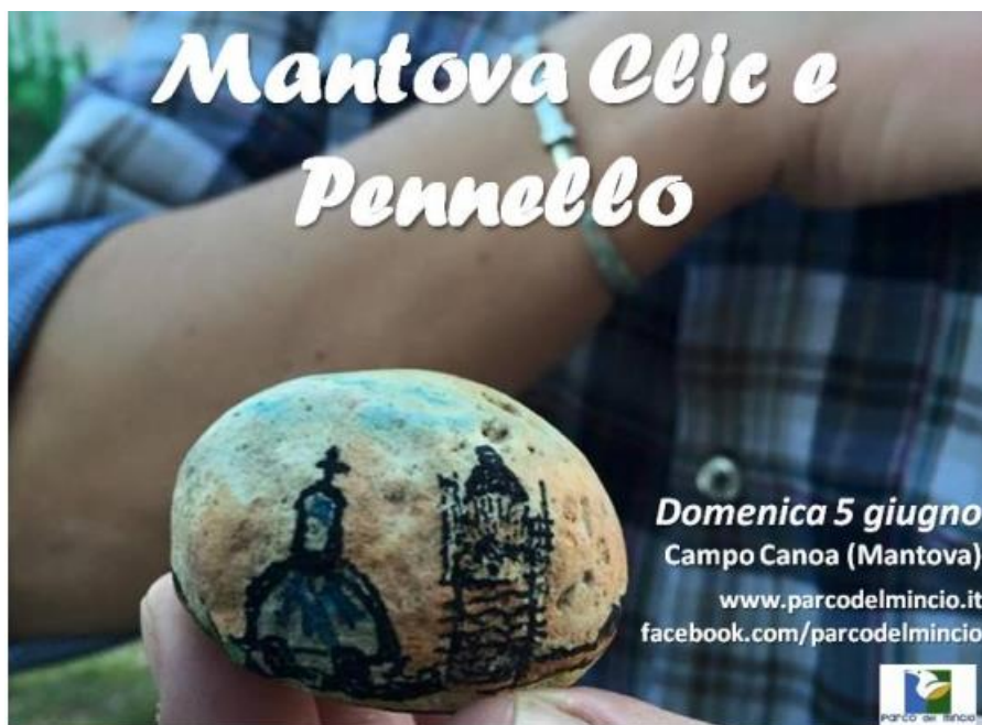
Il logo di Clic e Pennello 2016

MANTOVA. Fotografi, artisti, appassionati, domenica scorsa 5 giugno si sono ritrovati dall'alba al tramonto al Campo Canoa per ritrarre lo skyline di Mantova partecipando all'estemporanea di fotografia e arti grafiche organizzata dal Parco del Mincio in collaborazione con Mantova Capitale 2016. Tra tutte le foto postate sui social con l'hashtag #mantovaskyline sono state selezionate le migliori 6 in base ai like e alle reactions su Fb, integrati da una valutazione tecnica da parte della redazione ( qui potete scorrere l'album del Parco del Mincio tutte le foto della giornata ).