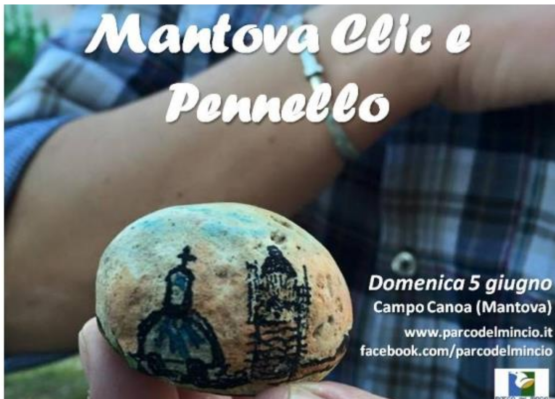
La locandina della seconda edizione di Mantova clic e pennello

Appuntamento al Campo Canoa per fotografi e pittori, il profilo della nostra città sarà di nuovo il tema della giornata, che si dividerà in tre orari: all'alba, all'ora di pranzo e al tramonto. #mantovaskyline l'hashtag per partecipare