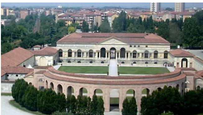
Una veduta di palazzo Te

Mantova, 22 aprile 2016 - Una mostra con circa 300 opere , donate al Comune e depositate nei sotterranei di Palazzo Te , sono esposte per la prima volta in una mostra che resterà aperta fino al 26 giugno, nell'ambito delle iniziative per Mantova Capitale Italiana della Cultura . Si tratta dei quadri di 147 artisti mantovani del Novecento, da Guindani a Lomini, da Defendi Semeghini a Nodari Pesenti, Giorgi e Bergonzoni.