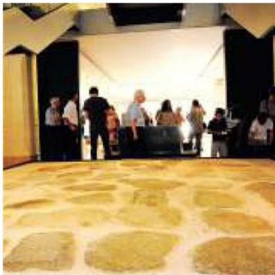
Alcune immagini dell'inaugurazione avvenuta ieri al museo archeologico (f. 2000)

menti, sarebbero rimasti nascosti alla vista ed avrebbero necessitato di permessi speciali per essere conosciuti.