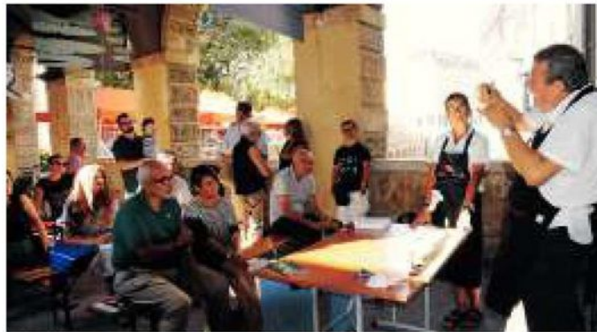
ieri mattina il primo evento alle Pescherie (F2000)

pericolosa arte consistente nell'immergere uno squalo cetorino e uno squalo tigre all'interno della stessa vasca. Una performance dove realtà e fantasia si fonderanno in un connubio perfetto. (l.n.)