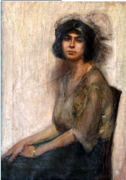
Opera di Mario Polpatelli