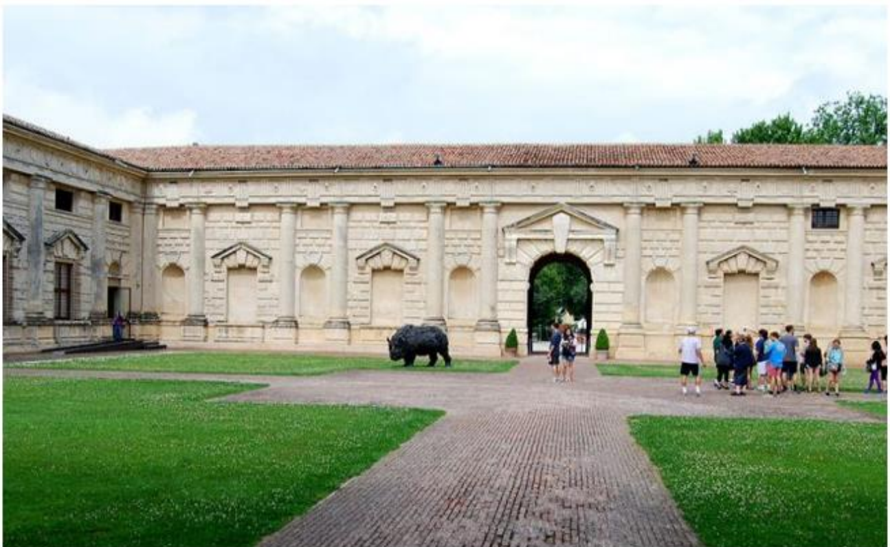
Rinoceronte a Palazzo Te, opera di Davide Rivalta