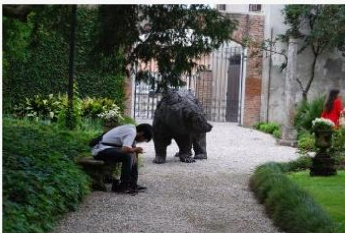
Orso, opera di Davide Rivalta, esposta a Palazzo d'Arco