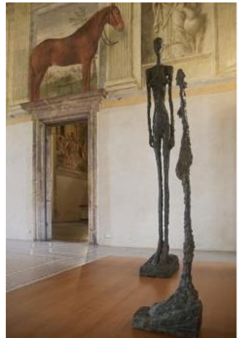
Figura e Grande Donna, opere di Alberto Giacometti