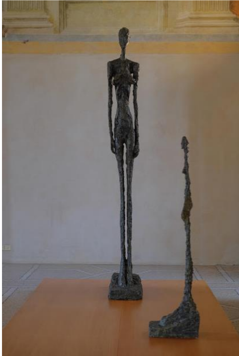
Un sogno fatto a Mantova - Palazzo Te, Opera di Giacometti