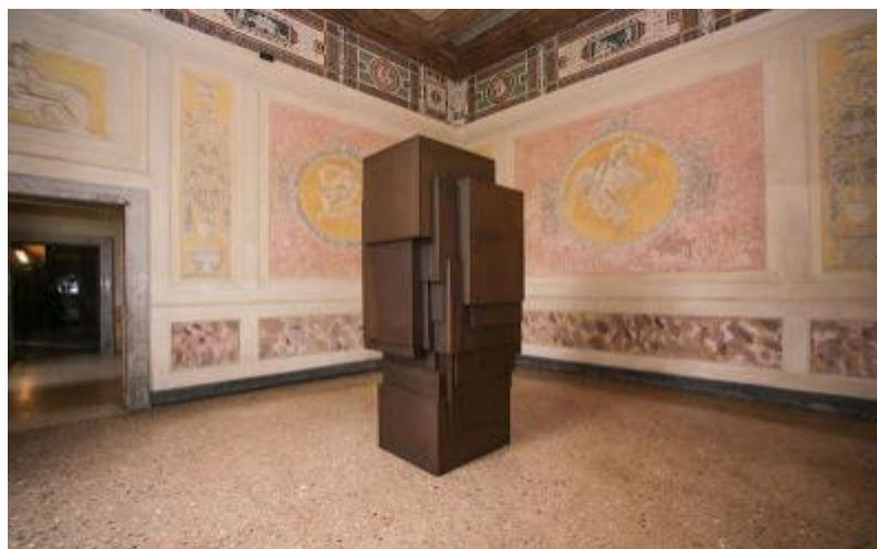
Un sogno fatto a Mantova - Palazzo Te, Opera di Gormley

Fall III (2015) di Antony Gormley dispiega una linea costante di riflessione dell'artista, che lavora sulla trasformazione del corpo (il corpo stesso dell'artista) in un volume statico, assoggettato al contesto, geometrizzato e tragico.