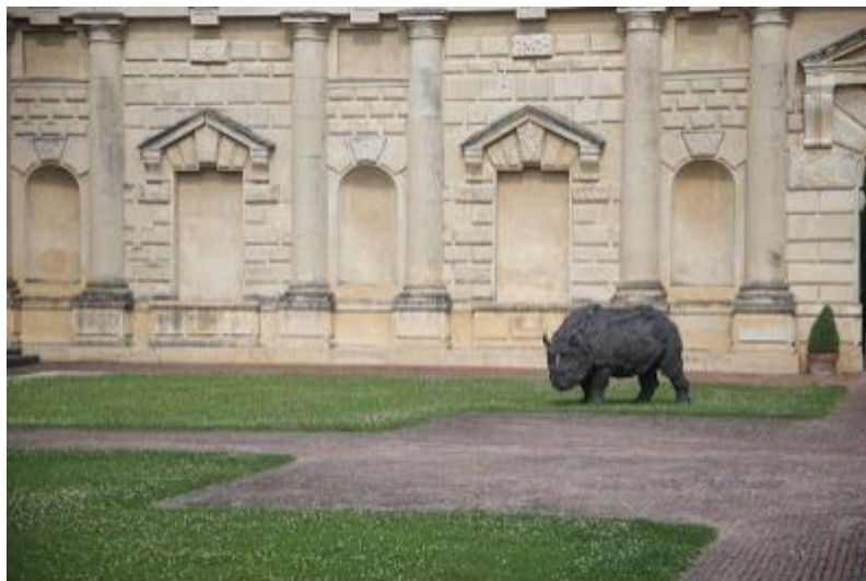
Un sogno fatto a Mantova - Palazzo Te, Opera di Rivalta

Il giardino romantico di Palazzo d'Arco, dimora patrizia di architettura neoclassica, ospita la scultura Orso dell'artista Davide Rivalta .