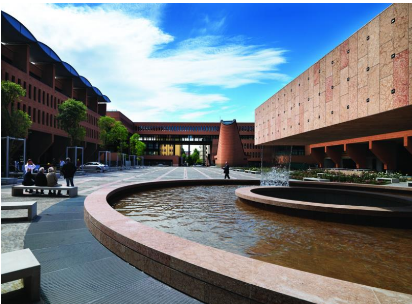
Mario Botta, Area ex Appiani Treviso

23 maggio 2016, ore 17:00, Tempio di San Sebastiano, Largo XXIV maggio, Mantova