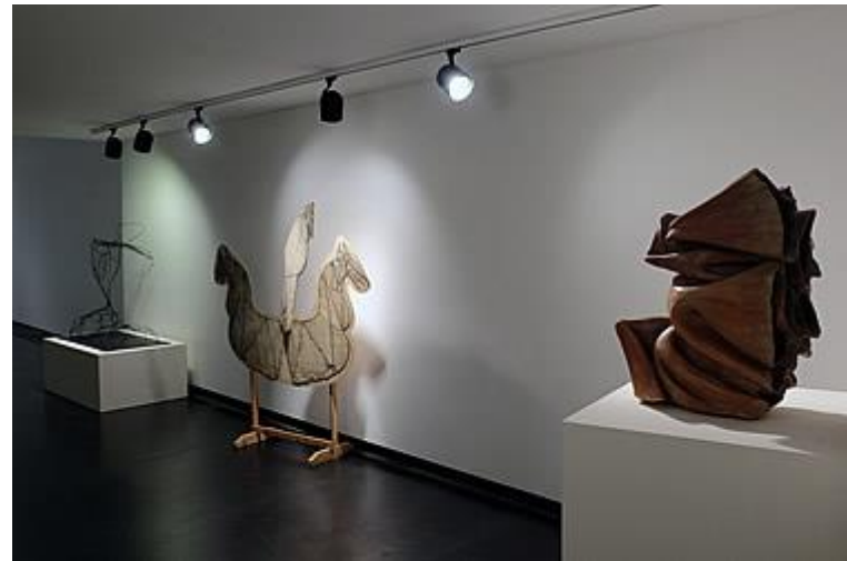
Allestimento Sale delle Fruttiere Palazzo Te