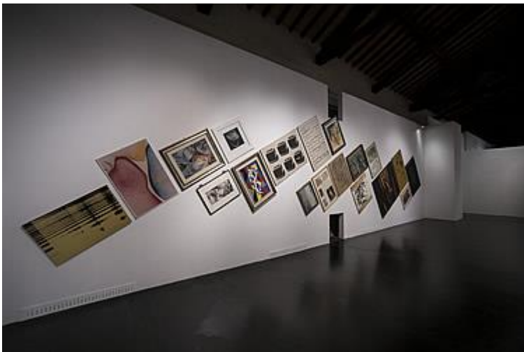
Allestimento Sale delle Fruttiere Palazzo Te

Sono 147 artisti presentati che in ordine alfabetico, vanno da Paolo Albani a Lucia Zuntini , dalla fine dell'Ottocento all'odierno. Impossibile in questa sede citarli tutti, ma va fatto presente che ci sono anche artisti contemporanei viventi. L'esposizione è coprodotta dal Centro Internazionale d'Arte di Palazzo Te e dal Museo Civico con l'Associazione Amici di Palazzo Te e dei Musei Mantovani e il sostegno della Banca Popolare di Mantova . L'esposizione stessa è un omaggio fatto da Stefano Arienti , notissimo maestro contemporaneo, alla sua città di nascita e agli artisti che hanno creato nella città virgiliana.