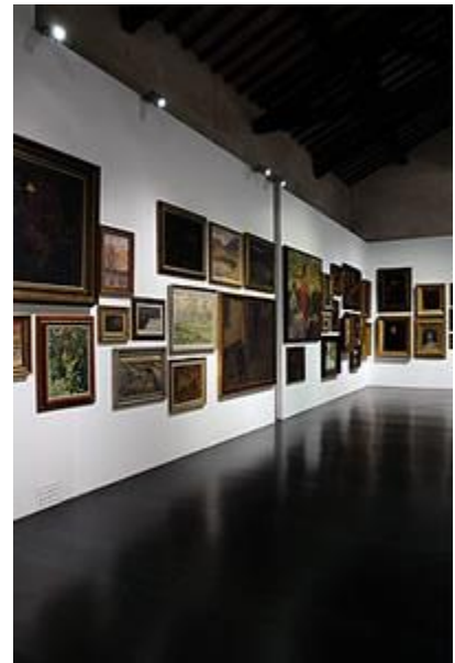
Allestimento Sale delle Fruttiere Palazzo Te

Promessa fin dai tempi del ventennio, in effetti la Galleria Civica di Arte Moderna non ha mai avuto un posto stabile. Si sono succedute nel tempo varie donazioni partendo da quella della Famiglia Defendi Semeghini che ha costituito il primo nucleo, poi al piccolo numero di pittori del primo Novecento, sono seguiti la donazione Giorgi , quella dei Tinelli Mondadori e le opere collocate nei palazzi civici.